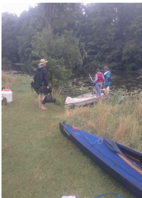
Unterwegs mit Jugendlichen aus Rudow (Lydiagemeinde)

Menschen, die sich mit Herz und Verstand einbringen möchten.